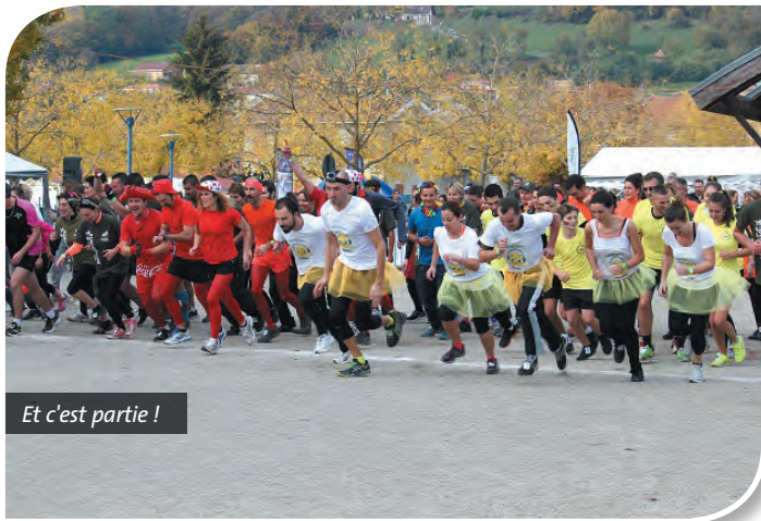
Et c'est partie !

Le 25 octobre dernier s'est déroulé à Colombe un événement sportif original qui a réuni plus d'un millier de personnes et de très nombreux bénévoles dans une ambiance chaleureuse et conviviale. Toute la journée, les plus courageux ont pu se challenger, courir, ramper, glisser... sur un parcours chronométré et semé d'obstacles sur 10 et 5 km. Les enfants, ont été accueillis par le Sou des écoles de Colombe et se sont amusés sur un petit circuit conçu spécialement pour eux. Et pour ceux n'ayant pas osé s'inscrire à la course, des associations du territoire ont donné des cours de gym douce, zumba, cardio-fitness... quand d'autres ont animé avec force le créneau 12-14h avec de très belles démonstrations d'hapkido, de judo et de rollers.