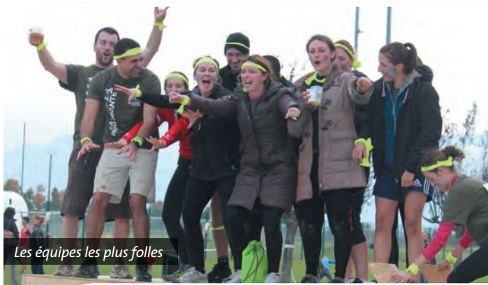
Les équipes les plus folles

Le 25 octobre dernier s'est déroulé à Colombe un événement sportif original qui a réuni plus d'un millier de personnes et de très nombreux bénévoles dans une ambiance chaleureuse et conviviale. Toute la journée, les plus courageux ont pu se challenger, courir, ramper, glisser... sur un parcours chronométré et semé d'obstacles sur 10 et 5 km. Les enfants, ont été accueillis par le Sou des écoles de Colombe et se sont amusés sur un petit circuit conçu spécialement pour eux. Et pour ceux n'ayant pas osé s'inscrire à la course, des associations du territoire ont donné des cours de gym douce, zumba, cardio-fitness... quand d'autres ont animé avec force le créneau 12-14h avec de très belles démonstrations d'hapkido, de judo et de rollers.