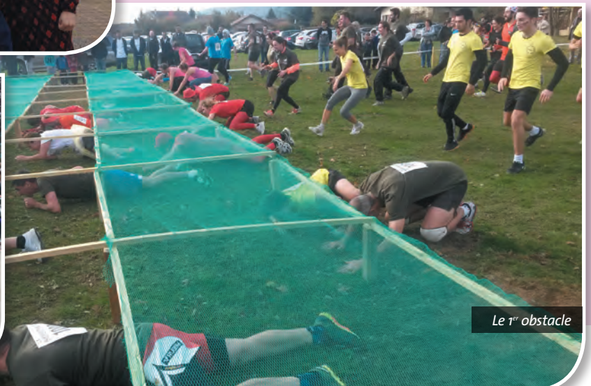
Le 1 er obstacle