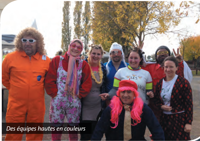
Des équipes hautes en couleurs

Organisée par l'association Bougez en Bièvre Est dont le siège est à Colombe, cette 1 ère course du type parcours du combattant, a rencontré son public venu du territoire... mais aussi d'ailleurs. Devant l'engouement général nous avons souhaité que se tienne sur Colombe une 2 ème édition. Elle se déroulera le 23 octobre 2016 et « de source sûre », en plus des ronces et des orties... 2016 verra l'apparition de la boue ! Vous retrouverez à la rentrée plus d'infos sur le site de la course : WWW.LA-RENVERSANTE.FR