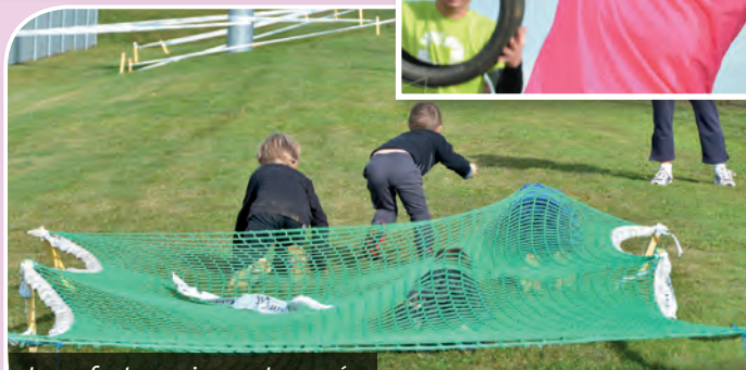
Les enfants aussi se sont amusés