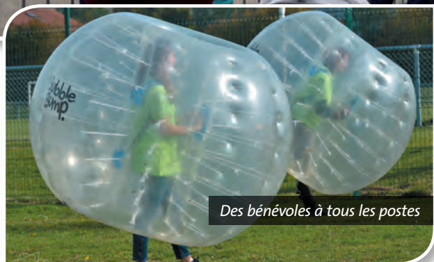
Des bénévoles à tous les postes